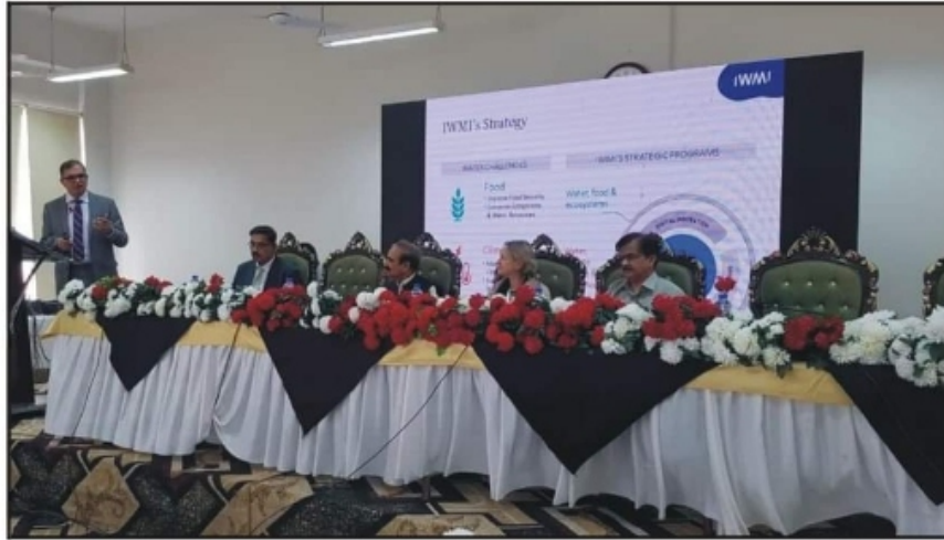
انٹرنیشنل واٹر مینجمنٹ انسٹیٹیوٹ کے اسلام آباد آفس کے افتتاح کے موقع پر مقررین خطاب کر رہے ہیں

اسلام آباد (سٹاف رپورٹر) انٹرنیشنل واٹر مینجمنٹ انسٹیٹیوٹ پاکستان نے اسلام آباد میں اپنے آفس کے افتتاح کے سلسلے میں ایک تقریب کا انعقاد کیا، جس میں PARC, IWMI، ڈیولپمنٹ سیکٹر کے اعلیٰ افسران کے علاوہ وزارت برائے موسمیاتی تبدیلی، وزارت برائے فوڈ سیکورٹی اور دیگر حکومتی اداروں کے نمائندوں نے شرکت کی۔ انٹرنیشنل واٹر مینجمنٹ انسٹیٹیوٹ مختلف تحقیق اور مباحثوں کے ذریعے آبی وسائل کو محفوظ بنانے اور اس کے دیرپا استعمال کو یقینی بنانے کے لیے کوشاں ہے۔ آفس کا افتتاح انٹرنیشنل واٹر مینجمنٹ انسٹیٹیوٹ کی ڈپٹی ڈائریکٹر جنرل ریحیل مکڈونل نے کیا۔ اس موقع پر ان کا کہنا تھا کہ انٹرنیشنل واٹر مینجمنٹ انسٹیٹیوٹ تحقیق کے ذریعے پائیدار ترقی کو حاصل کرنے کے لیے گامزن ہے تاکہ حکومت پاکستان پائیدار ترقی کے اہداف حاصل کر سکے۔ انٹرنیشنل واٹر مینجمنٹ انسٹیٹیوٹ پاکستان کے انچارج اور وسطی ایشیا کے انچارج ڈاکٹر حسن حفیظ کا کہنا تھا کہ انٹرنیشنل واٹر مینجمنٹ انسٹیٹیوٹ مختلف پراجیکٹس کے ذریعے آبی وسائل کے دیرپا استعمال کے لیے کوشاں ہے۔ اس موقع پر ایک نشست کا اہتمام بھی کیا گیا جس میں حکومت اور ڈیولپمنٹ سیکٹر سے منسلک ماہرین نے شرکت کی۔ انٹرنیشنل واٹر مینجمنٹ انسٹیٹیوٹ کا اسلام آباد آفس انٹرنیشنل ایگری کلچرل ریسرچ سنٹر (NARC) کی حدود میں واقع ہے۔